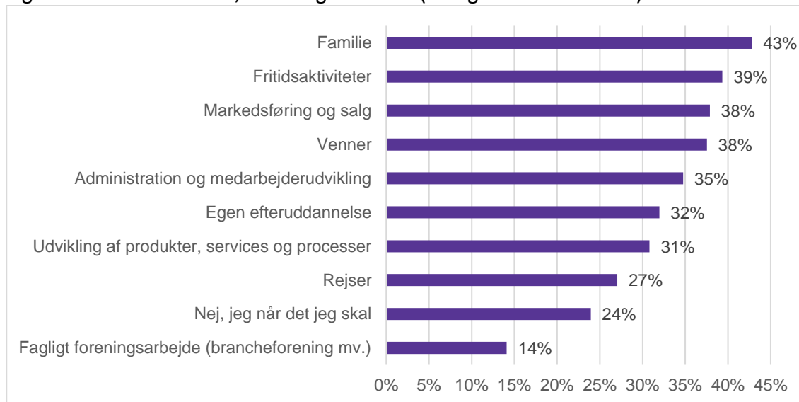
Figur 2: Er der aktiviteter, du mangler tid til? (Mulighed for flere svar)

Her svarede 43 pct., at de manglede tid til familie. 39 pct. svarede fritidsaktiviteter. Næsten ligeså mange, 38 pct., mener, at de mangler tid til venner og markedsføring og salg. Færrest har svaret, at de mangler tid til fagligt foreningsarbejde (brancheforening mv.).